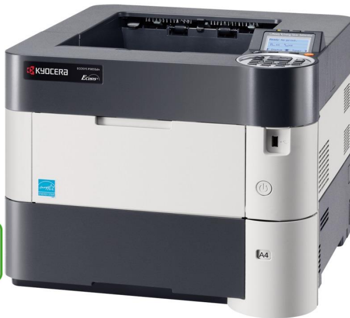
Abbildung zeigt ECOSYS P3055dn.

Nur für den internen Gebrauch. 01.11.2016